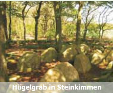
Hügelgrab in Steinkimmen

Die Gemeinde Ganderkesee hat kulturell und architektonisch einiges zu bieten. Lauschen Sie dem Klang der Arp-Schnitger-Orgel mit mehr als 1.100 Pfeifen. Tauchen Sie ein in das Steinzeitalter mit seinen Hügelgräbern. Lassen Sie sich vom Rauschen der Wassermühle in Elmelo inspirieren und entdecken Sie die "Ganter"-Gemeinde. Mehr als 80 überlebensgroße Ganter-Skulpturen haben sich im ganzen Gemeindegebiet niedergelassen. Und über einen Blick aus großen dunklen Augen unter Fellpuscheln sollten Sie sich bei uns ebenfalls nicht wundern. Denn auch Alpakas fühlen sich hier richtig wohl.